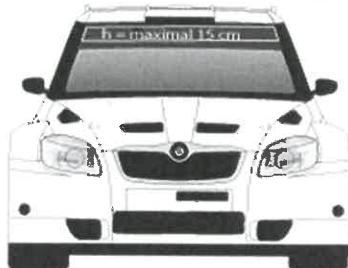
FRONTSCHIEBE LT. ARTIKEL 18.7.4 national